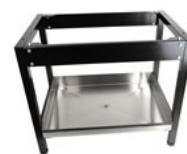
Gulvstativ lakkert IWD-H/E