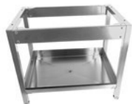
Gulvstativ rustfritt IWD-H/E