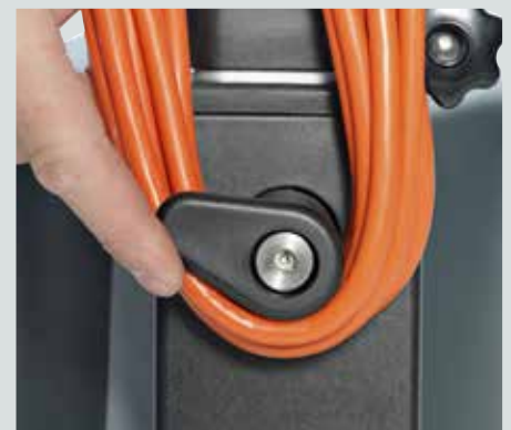
Kabelkrok slik at kabelen kan henges pent på maskinen