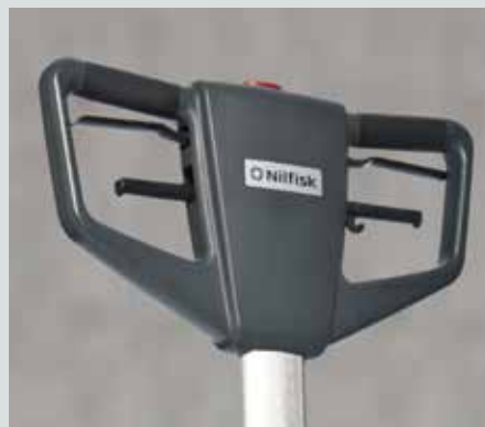
Ergonomisk riktig håndtak med avrundede kanter for økt komfort